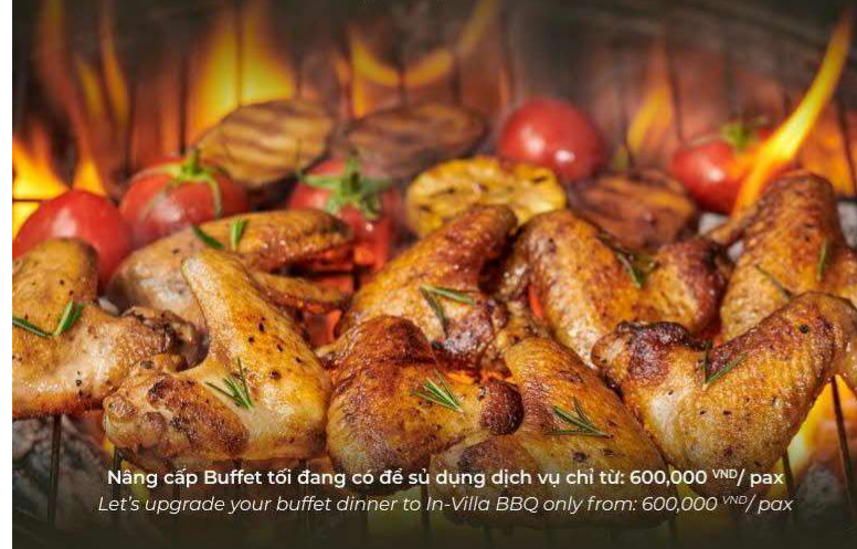
Nâng cấp Buffet tối đang có để sử dụng dịch vụ chỉ từ: 600,000 VND/ pax Let's upgrade your buffet dinner to In-Villa BBQ only from: 600,000 VND/ pax